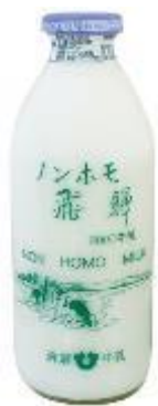
飛騨ノンホモ びん牛乳