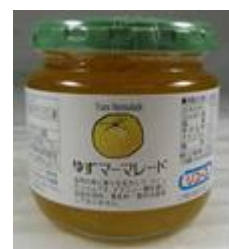
ゆずマーマレード 200g