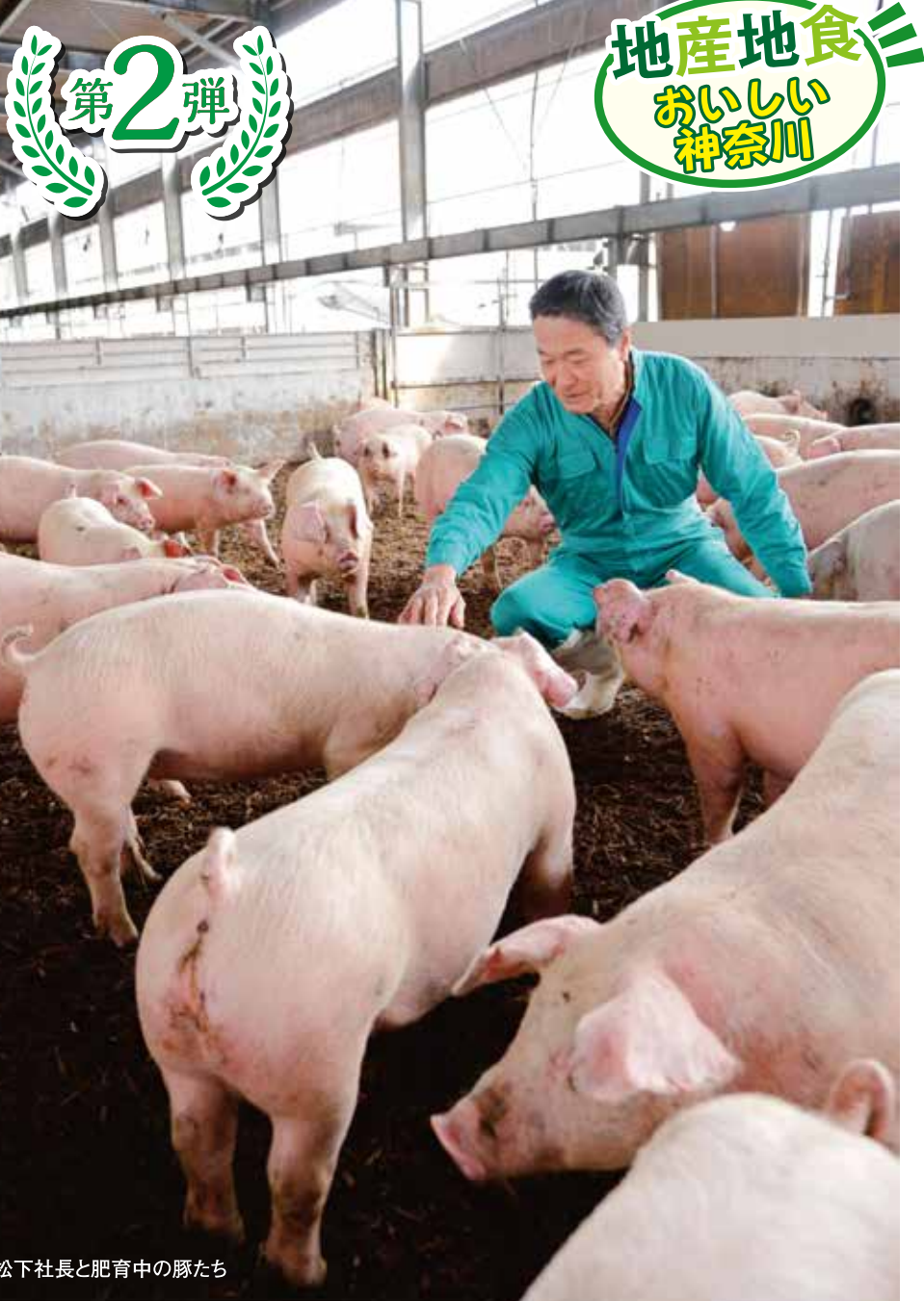
松下社長と肥育中の豚たち